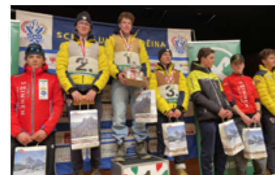
Sci di fondo