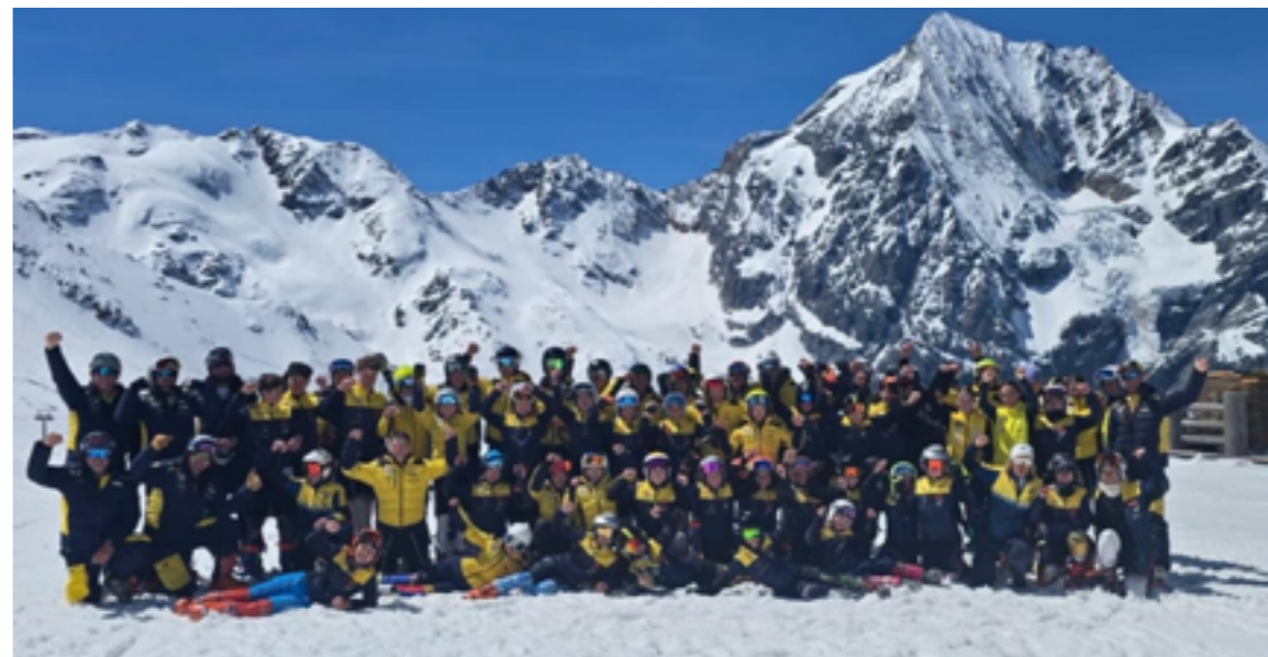
Allenamento di fine stagione