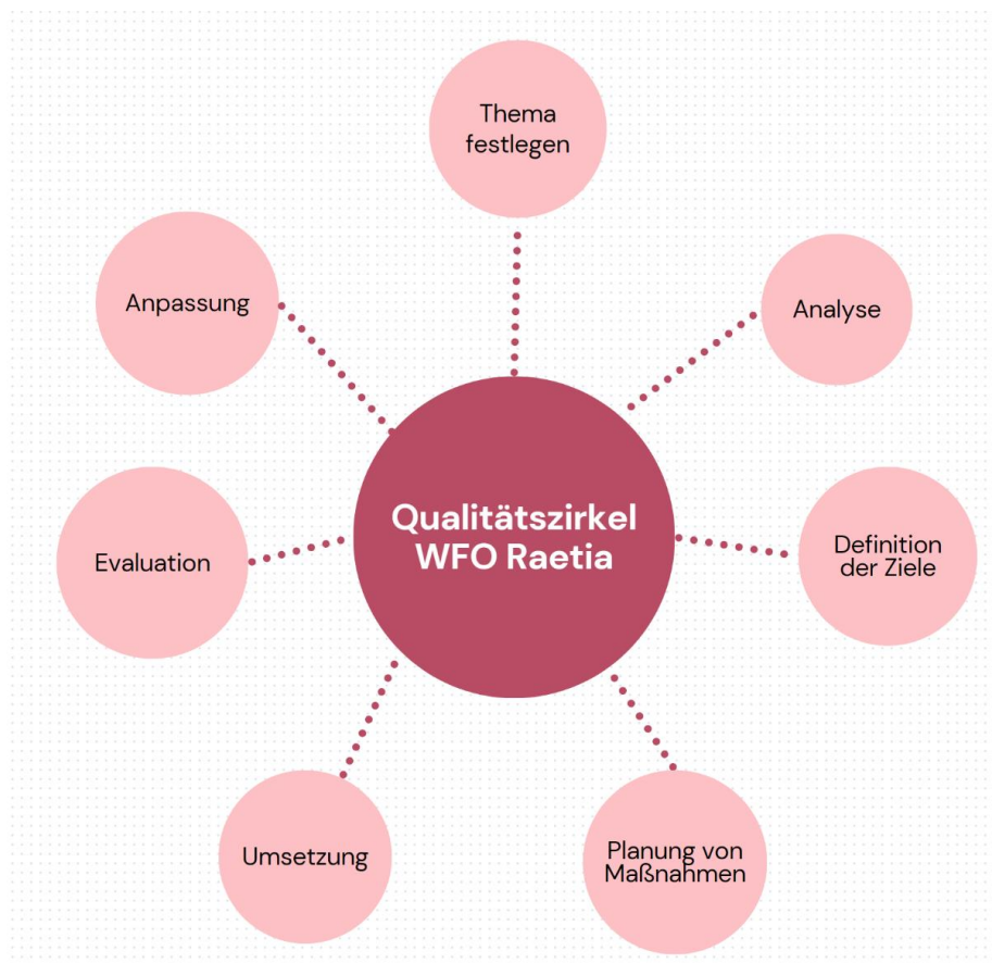
Immagine 2 – Qualitätszirkel WFO Raetia

Lernen am Puls der Zeit bedeutet für uns in Bewegung zu bleiben, immer wieder bewusst über unser Tun nachzudenken. Wir wollen unsere Stärken ausbauen, unsere Schwächen gezielt verringern. Dazu müssen wir beide kennen.