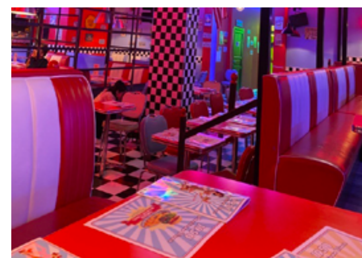
Momenti di svago al ristorante