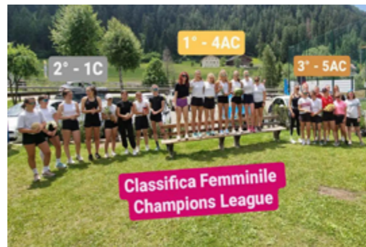
Champions League Femminile