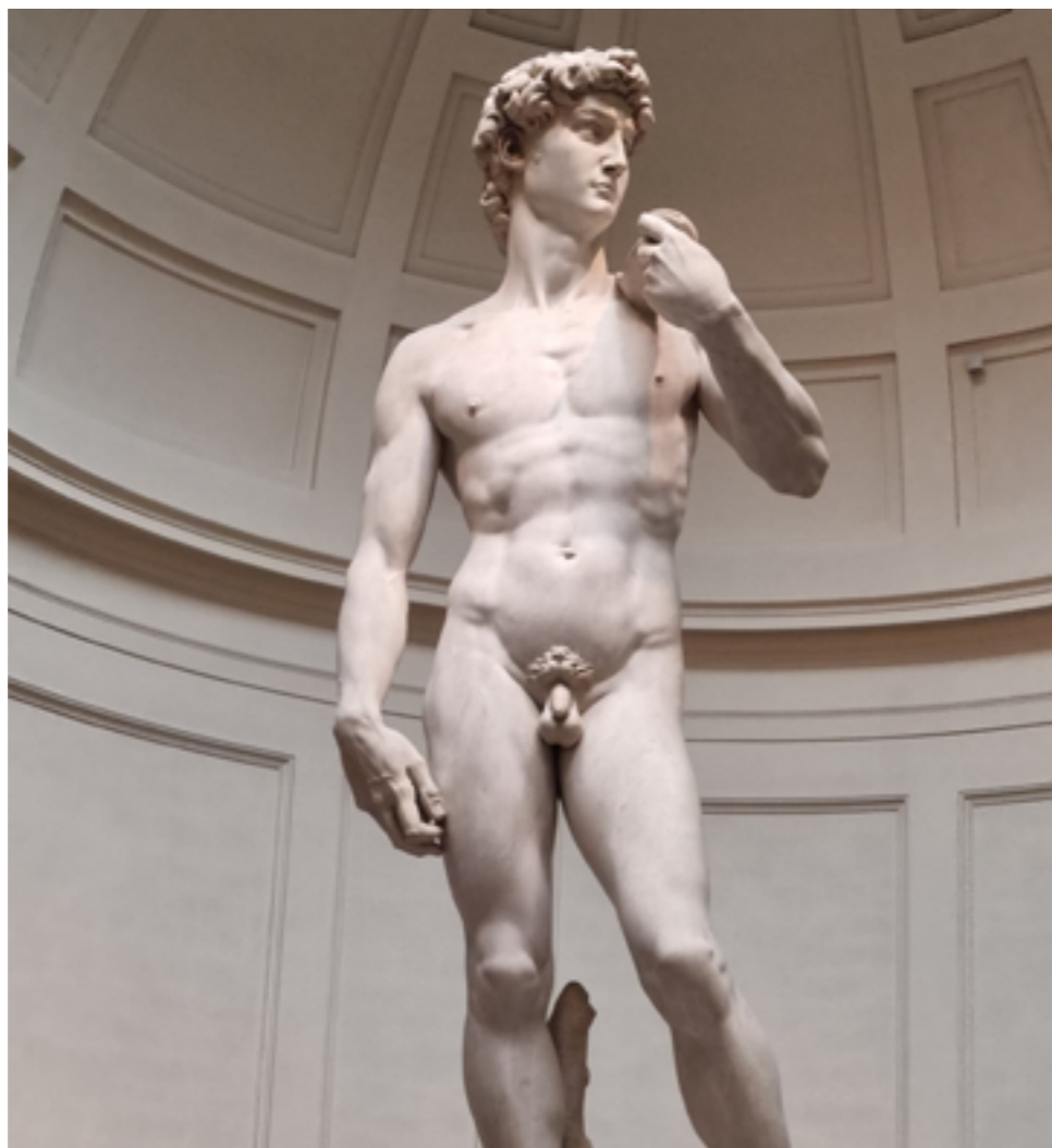
Il David di Michelangelo