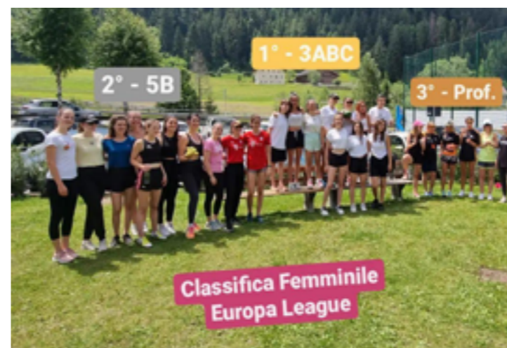
Europa League Femminile