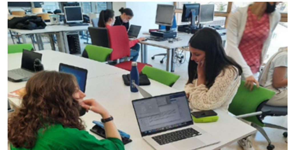
Kennenlernen des Xenus Programms