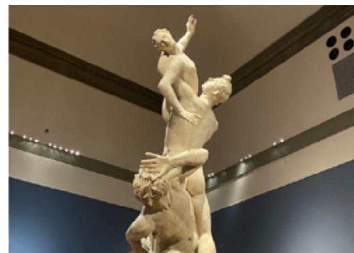
Il ratto delle sabine