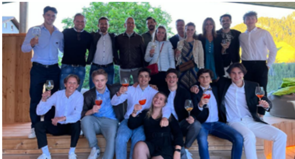
La 5A con tutti i professori

Sorvolando le solite cose come aperitivi, buffet e foto di gruppo, la serata si può dire essere iniziata quando alcuni membri delle varie classi hanno letto una poesia. Ma attenzione! La poesia in questione non era certamente una poesia qualunque, bensì una