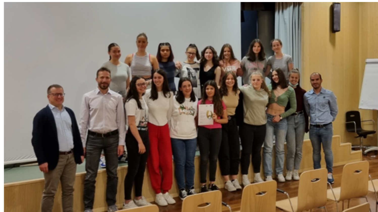
La classe IV B durante la consegna della certificazione "Qualitäts-Audit 2021"