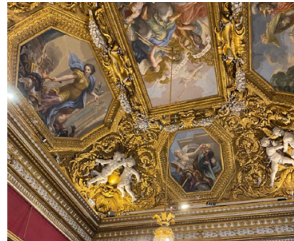
Affreschi sul soffitto di Palazzo Pitti