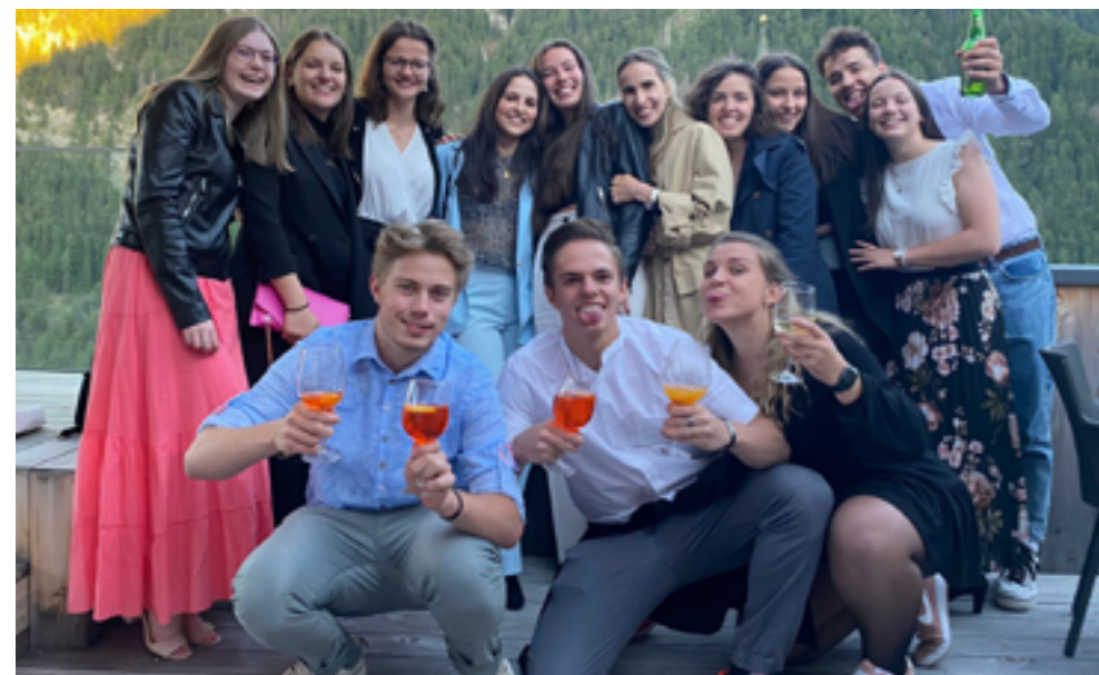
La 5B e alcuni alunni della 5A