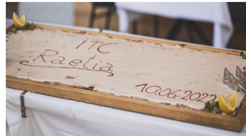
Delizie per cena