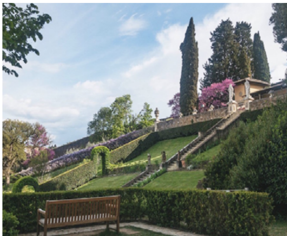
La scalinata barocca di Villa Bardini