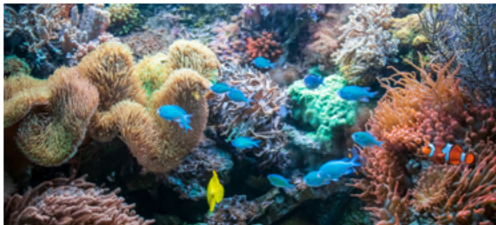
Corai mor ora pervia dla crem da surëdl