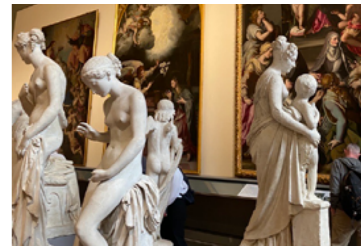
Statue e dipinti alla Galleria delle Belle Arti