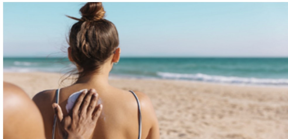
Crem da surèdl ie bon per l corp ma nia per l ambient

La zifra o l fator dla scunanza dal surèdl, che n possa liejer sun l