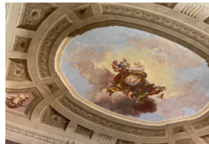
Affresco alla Galleria delle Belle Arti