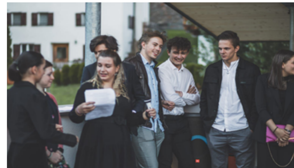
Lettura delle poesie