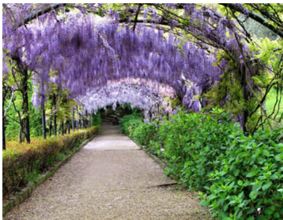
Il pergolato dei glicini di Villa Bardini