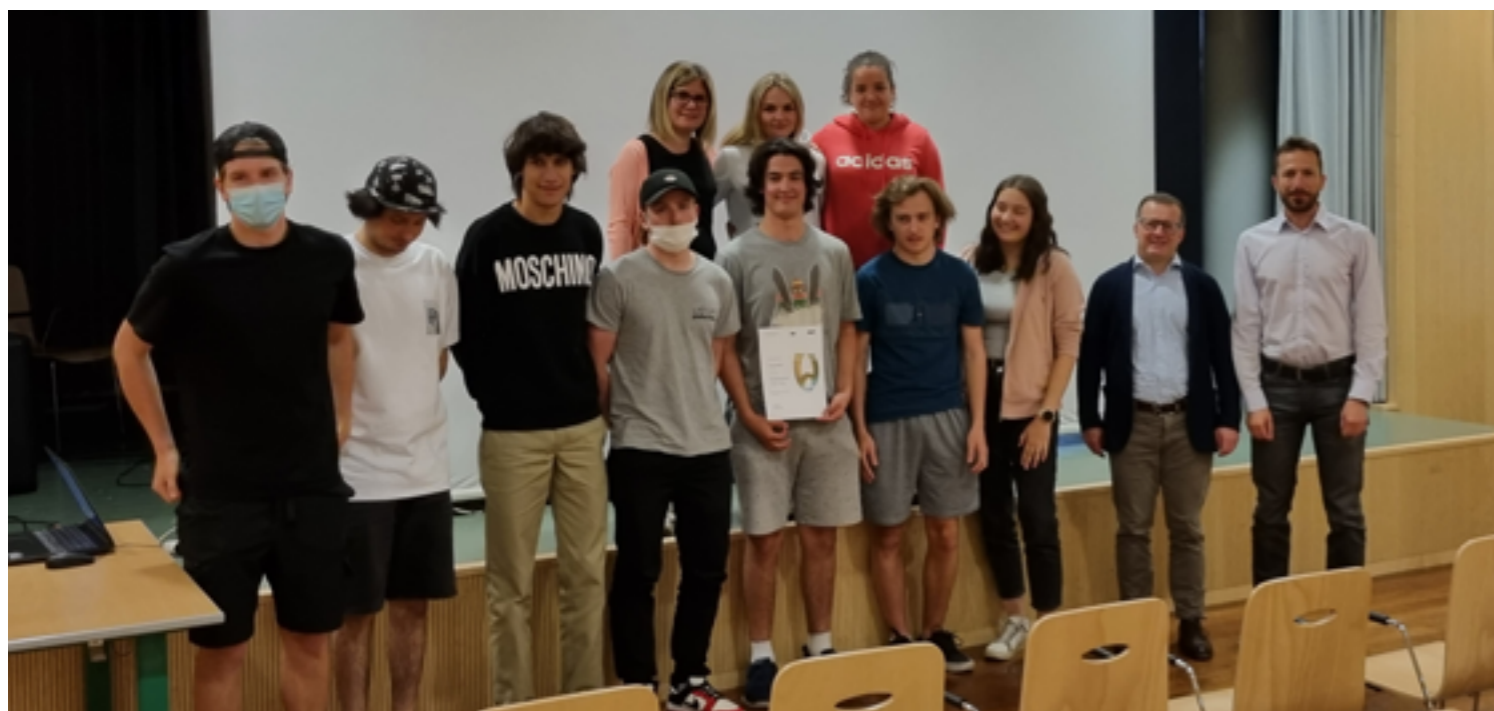
La classe IV A durante la consegna della certificazione "Qualitäts-Audit 2021"