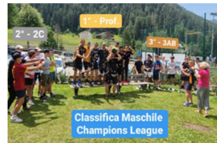
Champions League Maschile