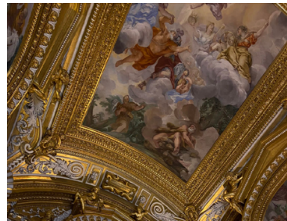
Affreschi sul soffitto di Palazzo Pitti