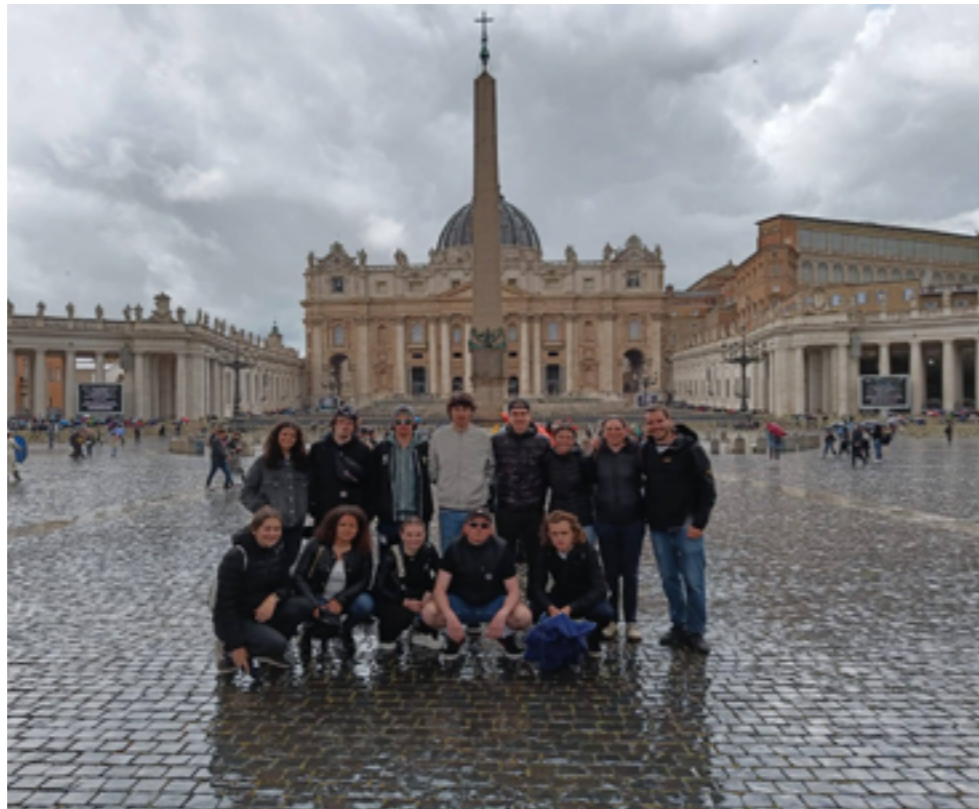
Die 4A in Rom

Am Ende des heurigen Schuljahres wurden zwei Tage organisiert, die dafür da waren uns Schüler der vierten Klassen auf unser heuriges Praktikum vorzubereiten und uns im Allgemeinen einen Einblick auf die Arbeitswelt zu geben.