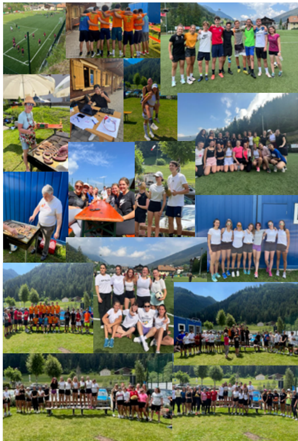
Alcuni momenti del torneo