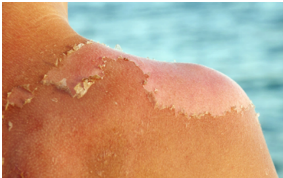
Canche n se bruja passel truep sanch tla vèines. N vèn cueceni

Che l vèn cunlià cërta carateristiche de cumpurtamènt o cumpetènzes a n cër' culèur dla pel ie mé cundiziunà dala cultura. Nscila iel truep africans y africanes che sauta lonc ajache l sport ie drèt pupuler iló. Che tan de jënt dala pel linèusa ebe arjont pesç nobel ie gaujà dal fat che te truepa universiteies europées y americanes pudova giut alalongia mé jì chèi dala pel linèusa. L ie da muiè che jënt dala pel plu scura vènie mo for tratada mel, scebèn che l culèur dla pel ne se lascia nia cunliè a cërta carateristiche de cumpurtamènt o cumpetènzes. Deguna sort de pel ie mièura che l'otra, duc à l medemo valor.