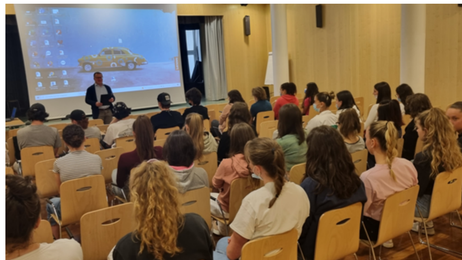
Cerimonia di premiazione "Qualitäts-Audit 2021" all'ITE Raetia