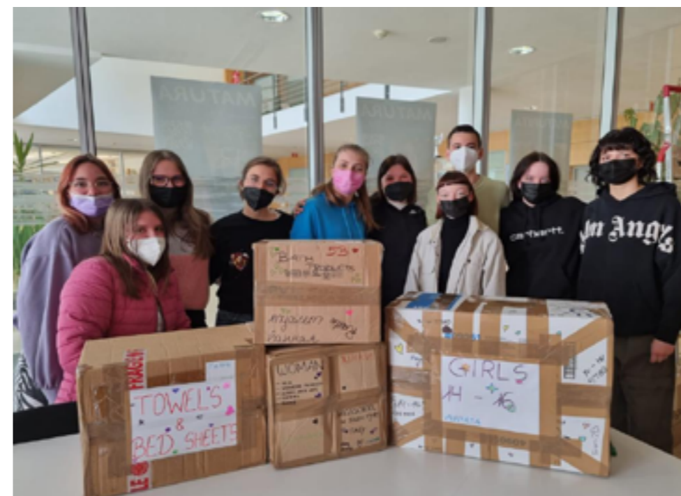
La classe 3 B durante la raccolta