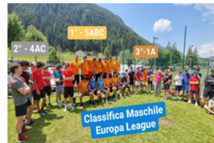
Europa League Maschile