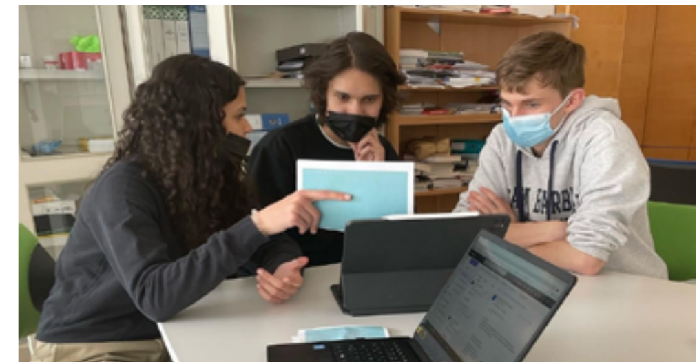
Tipps zum Vorstellungsgespräch